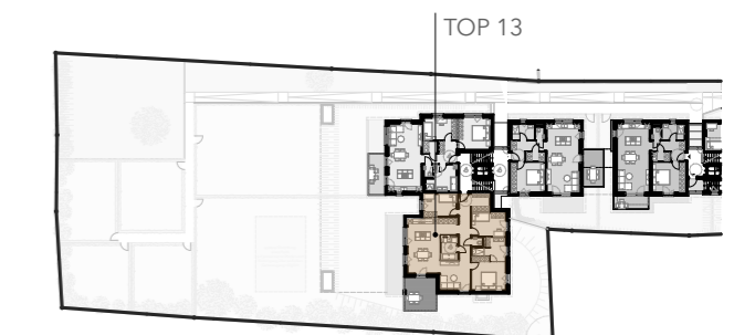
Übersicht 1. Obergeschoss